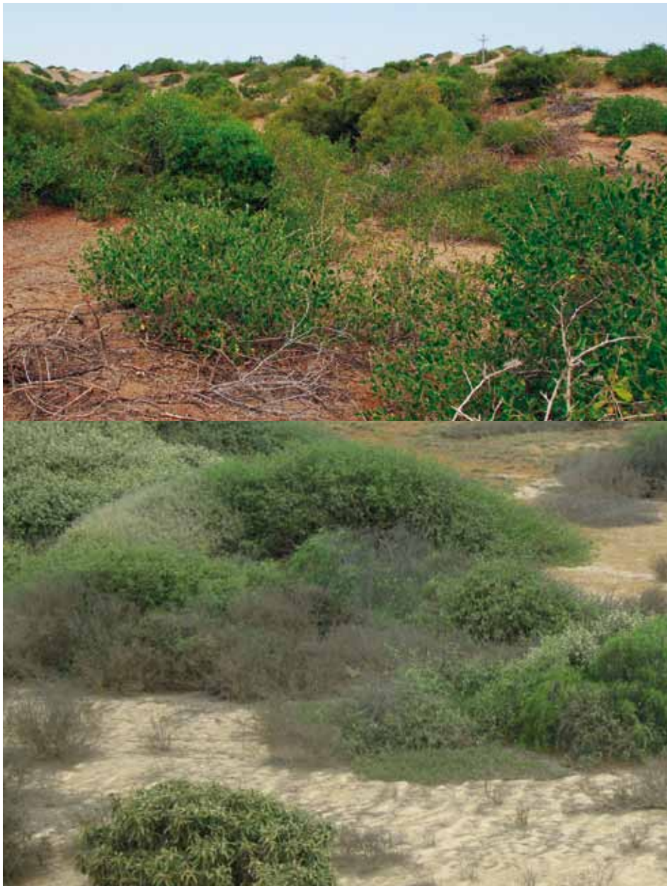
Figura 3. Hábitat del cortarramas peruano: arriba en Rafán, Lambayeque (sitio 34) y abajo El Gramadal, Ancash (sitio 77).

un nuevo lugar conocido como El Gramadal (Fig. 3), un matorral desértico con buena estructura vegetal, Romo y Rosina encontraron la hasta ahora mayor densidad de “cortarramas peruano”, con una población aproximada de 70 individuos en unas 100 ha, además de 9 nidos activos, volantes y juveniles en el 2010, 2011 y 2012 (Rosina & Romo 2010, 2012), así como en el 2013 (2 nidos vacíos y 3 volantes). En este lugar el éxito reproductivo es alto ya que de los 7 nidos activos, 6 fueron exitosos (85%) y de los huevos observados en el 2010 y el 2011 se habrían logrado el 75 y 60% respectivamente (Rosina & Romo 2012).