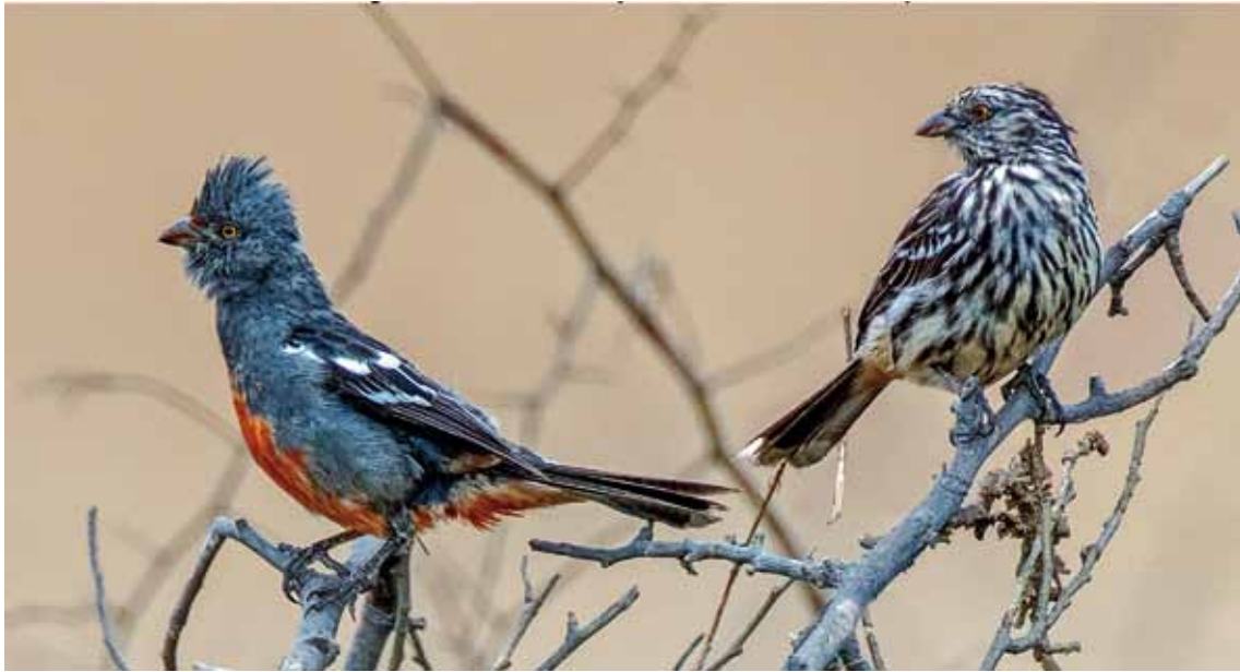
Figura 1. Cortarramas peruano macho y hembra adultos.