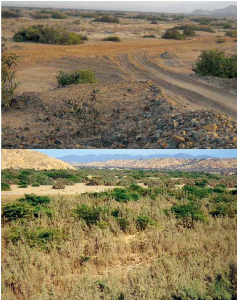
Figura 4. Amenazas al hábitat del cortarramas peruano: matorral destruido para agricultura en Mocán, La Libertad (sitio 70) y Quebrada Pariñas, Piura (sitio 6) con especie invasora Tamarix sp. (fotos Mónica Romo).

Lima.- Solo hay dos sitios registrados: en 1954 (Huaricanga, Paramonga) y 1982 (Valle del Chillón camino a Canta, no se especifica el punto) (Flanagan et al. 2009). Romo y Rosina visitaron Huaricanga el 26 de diciembre de 2011 y el 5 de abril de 2012 encontrando que los algarrobos y arbustos nativos han sido extirpados casi completamente y en la zona predomina la agricultura, quedando parches de bosque y matorral minúsculos y muy alterados. Consultamos a los pobladores locales y no han visto ni conocen al ave. No hay más registros para Lima.